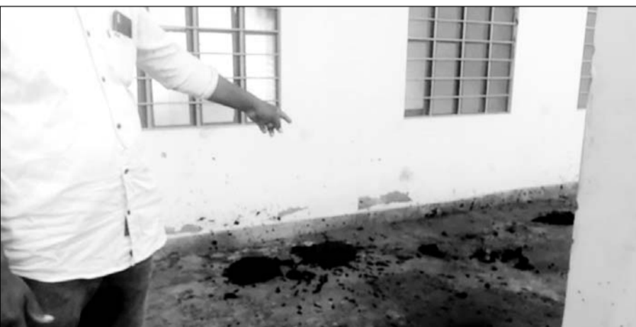
बडोदिया सरकारी स्कूल में पड़ा जानवरों का मलवा।

आज के वक्त उपखण्ड के बडोदिया ग्राम पंचायत में स्थित राजकीय स्कूल की दशा इन दिनों बड़ी