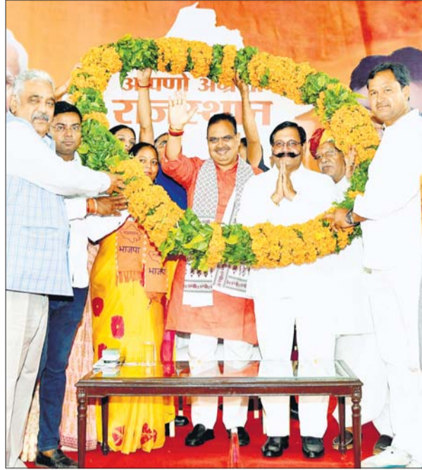
माटी कला को बजट घोषणाओं में विशेष प्रोत्साहन देने के लिए प्रजापति समाज ने मुख्यमंत्री भजनलाल शर्मा को माला पहनाकर धन्यवाद दिया। मुख्यमंत्री ने इस मौके पर आयोजित सभा में कहा कि राज्य सरकार दस्तकारों की कला को प्रोत्साहन देने के लिए अगले तीन साल में 50 क्लस्टर विकसित करने जा रही है।

शर्मा ने कहा कि पीएम विश्वकर्मा योजना के तहत 18 व्यवसायों के दस्तकारों को 5 प्रतिशत की दर पर ऋण उपलब्ध कराया जा रहा है। राज्य सरकार ऐसे ऋणों पर 2 प्रतिशत का अतिरिक्त ब्याज अनुदान देगी। उन्होंने कहा कि रोजगार व नियोक्ति को बढ़ावा देने के लिए एम.एस.एम.ई. पॉलिसी-2024 लायी जाएगी। हमारी सरकार ने उद्यमियों की