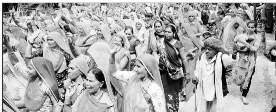
स्कूलों में पोषाहार बनाने वाली महिलाओं ने बकाया वेतन सहित अपनी मांगों को लेकर जिला कलेक्टर पर प्रदर्शन किया।