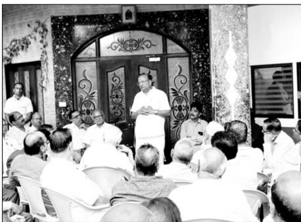
महालक्ष्मी रथयात्रा को लेकर बैठक आयोजित हुई।