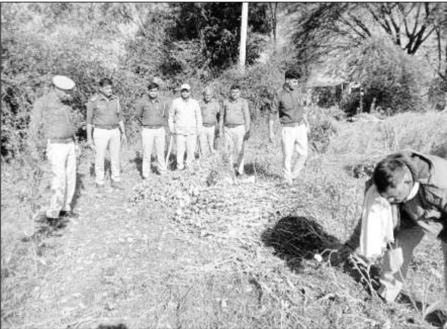
जिला मुख्यालय के समीप पदेवा गांव में पुलिस ने अवैध रूप से की जा रही अफीम की खेती पकड़ी।

पुलिस को पदेवा गांव के खेतों में अफीम की अवैध खेती होने की सूचना मिली थी