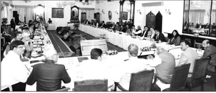
राज्यपाल हरिभाऊ बागड़े ने बुधवार को लोकभवन में कुलगुरु समन्वय समिति की बैठक ली। उनके साथ उपमुख्यमंत्री और उच्च शिक्षा मंत्री प्रमचंद्र बैरवा और चिकित्सा मंत्री गजेंद्र सिंह खीवसर भी मौजूद थे।

जयपुर (कास)। राज्यपाल एवं कुलाधिपति हरिभाऊ बागड़े ने कहा कि उच्च शिक्षा में "सुधरो नहीं तो बंद करो" नीति पर कार्य किया जाएगा। उन्होंने स्पष्ट कहा कि राज्य में शैक्षिक गुणवत्ता पर नहीं कोई समझौता नहीं किया जाएगा। ऐसे शिक्षण संस्थान जिनके पास शैक्षिक गुणवत्ता नहीं है, उसे बंद किया जाए। बाँर अनुमति यदि कहीं किसी कॉलेज या शिक्षण संस्था की विश्वविद्यालय स्तर पर मान्यता दी गई है तो उस पर सख्त कार्यवाही की जाएगी। राज्यपाल ने विश्वविद्यालयों को सुदृढ़ किए जाने और वहां नियुक्त कुलपुरुओं का मनोबल बढ़ाने के लिए भी कार्य किए जाने पर जोर दिया। उन्होंने कहा कि राज्य में स्कूल से उच्च शिक्षा को बेहतर बनाने के लिए अधिक से अधिक प्रयास हों। शिक्षा ही विकास की नींव है, इसलिए इसके उत्थान के लिए सभी स्तरों पर प्रयास हों।