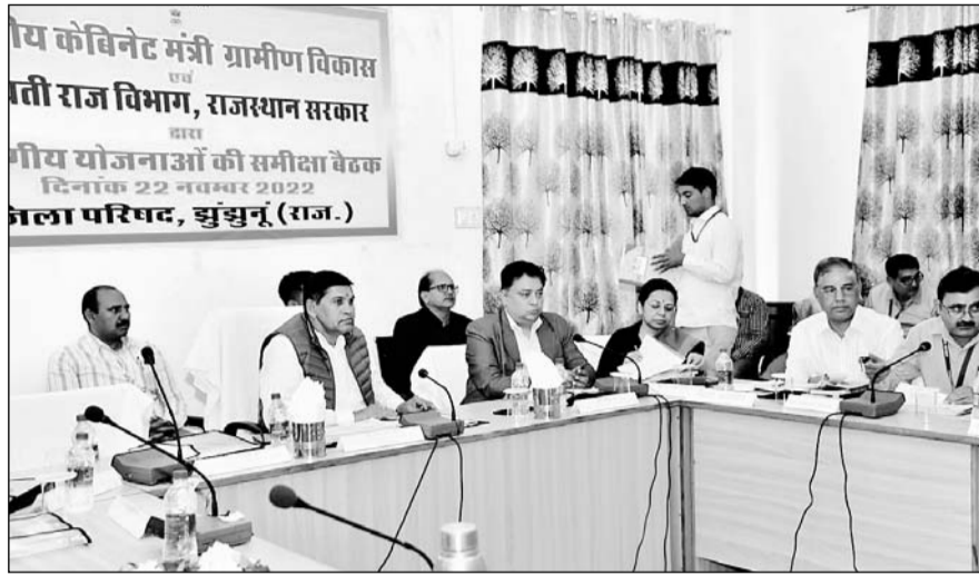
पंचायती राज मंत्री रमेश मीणा ने विभागीय अधिकारियों की बैठक ली।

आपको बाबू के आंकड़ों के आधार पर पारंपरिक तरीके से कार्य करने की जगह विभाग की गाइडलाइन व बुक का ज्ञान होना चाहिए। इसके लिए मीणा ने जिला परिषद सीईओ जवाहर चौधरी को भी जिम्मेदार ठहराया और कहा कि सीईओ की सही मॉनिटरिंग और लापरवाही के कारण जिले में ऐसे हालात हो रहे हैं। जो सही नहीं है। विकास अधिकारी अपने क्षेत्र में चल रहे विकास कार्यों की भी सही जानकारी नहीं दे पाए। उन्होंने कहा कि विभाग की कोशिश है कि नई गाइडलाइन से आमजन को फायदा मिल सके। विकास अधिकारी बाबूओं