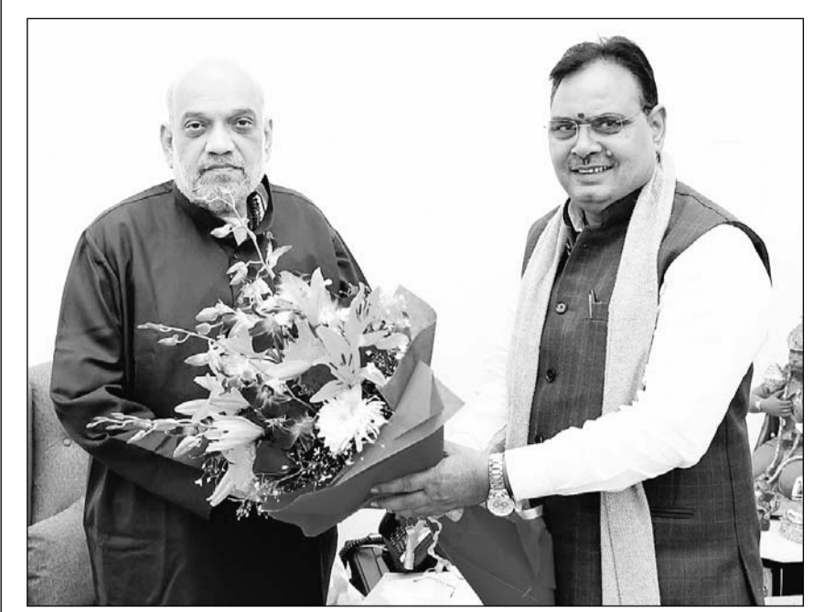
मुख्यमंत्री भजनलाल शर्मा ने रविवार को नई दिल्ली में केंद्रीय गृह मंत्री अमित शाह से शिष्टाचार भेंट की। इस दौरान उन्होंने शाह को गुलदस्ता भेंट किया।