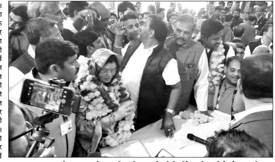
सलूमबर उपचुनाव की मतगणना के बाद विजयी प्रत्याशी की रिटर्निंग अधिकारी ने घोषणा की।

उल्लेखनीय है कि सलूमबर विधानसभा के 2023 में हुए चुनाव