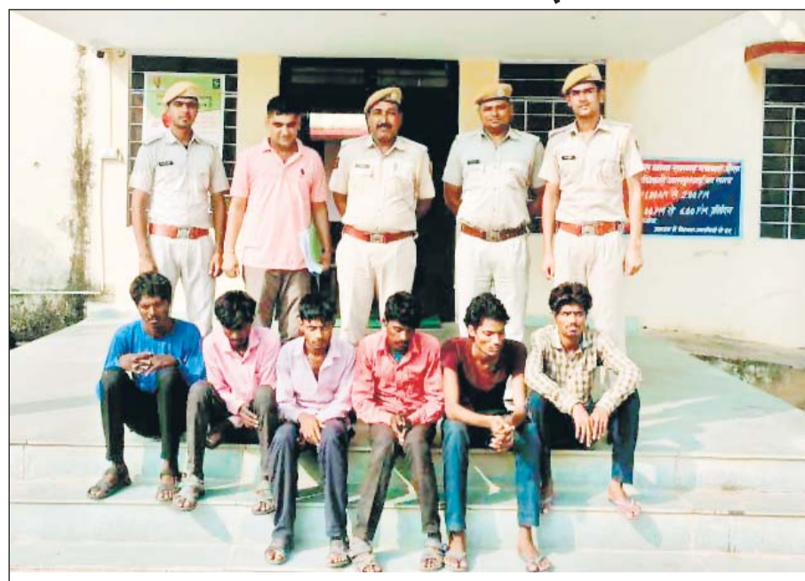
रामगढ़ थाना क्षेत्र में चोरी की वारदात को अंजाम देने वाले आरोपियों को पुलिस ने गिरफ्तार किया।