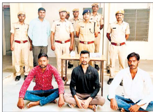
टोडारयसिंह थाना क्षेत्र के एक हिस्ट्रीशीटर व दो बदमाशों को गिरफ्तार किया।