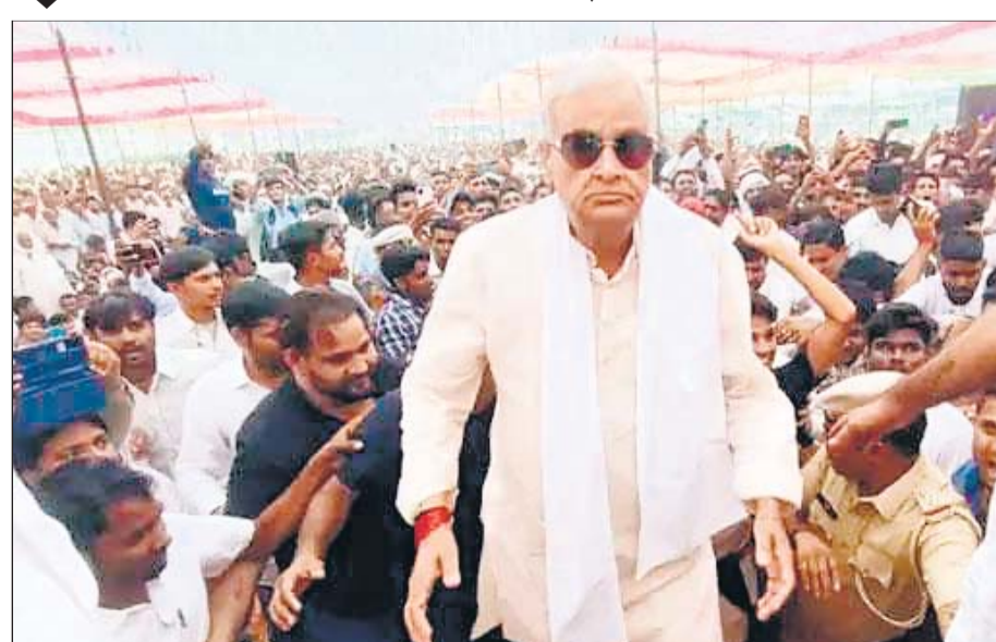
सांसद डॉ. किरोड़ी लाल मीणा कई मुद्दों को लेकर थानागाजी में भीड़ के साथ जुटे।

डॉ. किरोड़ी ने एक दिन पहले ही सरिस्का के मौजूदा बड़े अफसरों पर वन विभाग की जमीन पर कब्जा करने के आरोप लगाए थे। इतना तक कहा कि अवैध होटल बनवाने में सरिस्का के अफसर मिले हुए हैं। इन होटलों में स्थानीय को रोजगार तक नहीं मिलता। वहीं ईआरसीपी योजना को लेकर प्रदेश की कांग्रेस सरकार को घेरने की तैयारी है। इन सब मसलों पर व थानागाजी के ग्रामीणों के बीच पहुंचे। थानागाजी में राजकीय उच्च माध्यमिक स्कूल में बड़ी भीड़ पहुंची। लोगों को संबोधित कर किरोड़ी लाल मीणा ने पैदल कूच का ऐलान किया। वे 10 किलोमीटर की पैदल रैली निकाल सवते हैं वे सरिस्का गेट की तरफ आगे बढ़े। इसके बाद सरिस्का