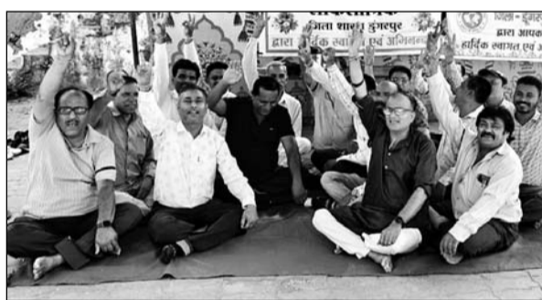
ग्रीष्मवकाश कटौती के विरोध में शिक्षक संगठन ने प्रदर्शन किया।