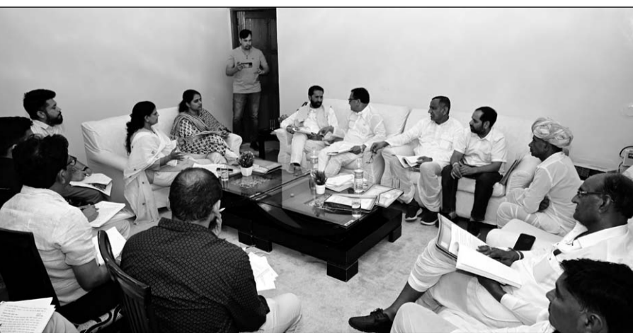
श्री सांवलिया मंदिर बोर्ड मंडफिया की बैठक आयोजित हुई।

बैठक में मंदिर विकास योजना की समीक्षा के साथ यात्री सुविधाओं सहित मंदिर के विकास व विस्तार हेतु विभिन्न विषयों पर चर्चा की गई। जिसमें मंदिर व्यवस्था परंपरागत महाप्रसाद, साधु संतों एवं असहाय गरीबों को भोजन, वेतन एवं भत्ते, यात्रा भत्ता, चिकित्सा वाहन के ईंधन एवं संधारण मशीनों साज सामान संयंत्र क्रय व संधारण, कार्यालय व्यवस्था, विज्ञापन एवं प्रचार प्रसार व्यवस्था, विद्युत व्यवस्था, जल एवं साफ सफाई व्यवस्था, मेला आयोजन एवं वर्षभर विभिन्न पर्वों पर आयोजित होने वाले धार्मिक व सांस्कृतिक कार्यक्रमों, गौशाला