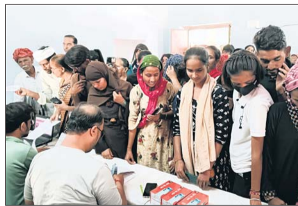
शिविर में मोबाइल पाने वाले सैकड़ों लोगों की भीड़ उमड़ी।

मोबाइल लेने आने वाले कुछ लोगों ने यह भी आरोप लगाया कि मोबाइल वितरण में भेदभाव बरता जा रहा है तथा जिन लोगों की सांटागांट और जेन पहचान है उनका नंबर नहीं होने के बाद भी उनको मोबाइल