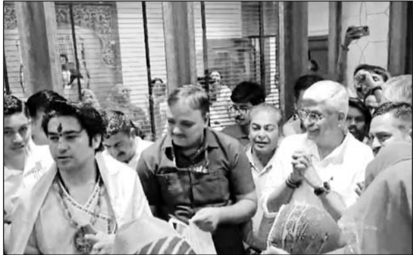
बागेश्वर धाम पीठाधीश्वर पंडित धीरेन्द्र कृष्ण शास्त्री का जोधपुर पहुंचने पर स्वागत किया।

जोधपुर, (कासं)। जोधपुर के रावण का चबूतरा मैदान में सोमवार को बागेश्वर धाम पीठाधीश्वर पंडित धीरेन्द्र कृष्ण शास्त्री ने धर्म सभा को संबोधित किया। उन्होंने कहा कि भारत बाबर का नहीं, रघुवर का देश है। उन्होंने आध्यात्मिक समाधान सत्र में श्रद्धालुओं को संबोधित करते कहा धर्म विरोधियों को ठठरी भी बांधेंगे। हम किसी भी मजहब के विरोधी नहीं हैं लेकिन अपने धर्म के कट्टर भी हैं। कायदे में रहोगे तो फायदे में रहोगे। लोग हमसे कहते हैं आपको किसी से डर नहीं लगता। हमने कहा हम हिंदुओं को एकजुट करने आए हैं। जब तक हमारे तन में प्राण रहेंगे तब तक हम हिंदुओं को एक करते रहेंगे।