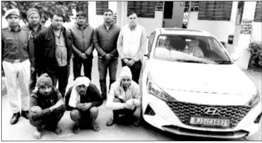
सपोटरा थाना पुलिस ने स्मैक तस्करों को गिरफ्तार किया

निर्देशन में चलाए जा रहे धरपकड़ अभियान और स्मैक के विरुद्ध कार्रवाई के दौरान सपोटरा थाना पुलिस और जिला स्पेशल टीम ने एक स्मैक तस्कर सहित तीन व्यक्तियों को गिरफ्तार कर उनके कब्जे से 32 ग्राम 80 मिलीग्राम अवैध मादक पदार्थ स्मैक, पांच मोबाइल एवं एक कार जप्त कर ली है। उन्होंने बताया कि सपोटरा थाने से स्वयं के नेतृत्व में पुलिस टीम का गठन किया गया। थाना सपोटरा पुलिस द्वारा