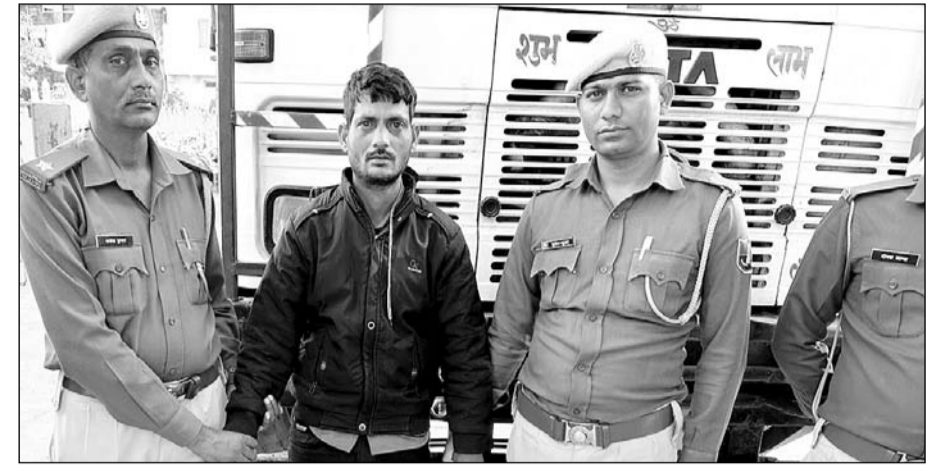
बिजौलियां थाना पुलिस ने भारी मात्रा में अवैध गांजा बरामद कर तस्कर को गिरफ्तार किया।

कोटा से बिजौलियां की ओर आ रहे ट्रक में 665.50 किलोग्राम गांजा बरामद किया