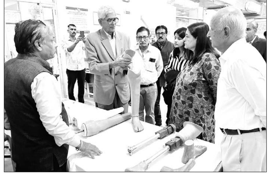
पूर्व केन्द्रीय मंत्री और भारतीय जनता पार्टी की वरिष्ठ नेता मेनका गांधी ने भगवान महावीर विकलांग सहायता समिति में विश्व प्रसिद्ध जयपुर फुट की निर्माण विधि देखी।

जयपुर। पूर्व केन्द्रीय मंत्री और भारतीय जनता पार्टी की वरिष्ठ नेता मेनका गांधी ने भगवान महावीर विकलांग सहायता समिति (बी.एम.वी.एस.ए.) में विश्व प्रसिद्ध जयपुर फुट की निर्माण विधि देखी। पूर्व केन्द्रीय मंत्री मेनका गांधी का बी.एम.वी.एस.ए. के संस्थापक और