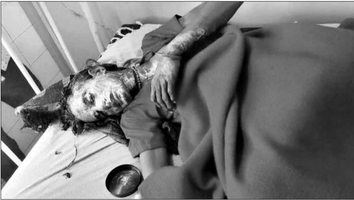
एसिड अटैक में घायल महिला का अस्पताल में उपचार जारी है।