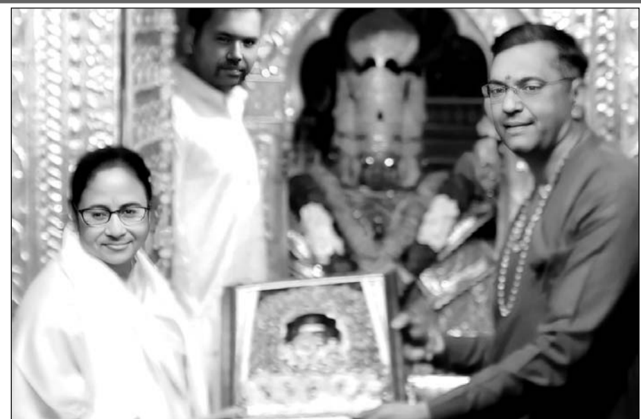
पुष्कर में ब्रह्मा मंदिर में दर्शन करने के बाद मंहत ने मुख्यमंत्री ममता बनर्जी को स्मृति चिन्ह भेंट किया।

अजमेर/ पुष्कर/ मदनगंज, (कासं)। पश्चिम बंगाल की मुख्यमंत्री ममता बनर्जी अपने एक दिवसीय दौरे पर मंगलवार सुबह अजमेर पहुंचीं। सीएम बनर्जी को कड़ी सुरक्षा के बीच उन्हें किशनगढ़ एयरपोर्ट से अजमेर लाया गया। बनर्जी ने सुफी संत ख्वाजा साहब की दरगाह में सुफी परंपरा के अनुरूप दरगाह जियारत कर अकौदत के फूल और मखमली चादर पेश कर देश में अमन, चैन और खुशहाली की दुआ मांगी। इसके बाद बनर्जी पुष्कर पहुंचीं, जहां उन्होंने पुष्कर सरोवर में पूजा अर्चना कर ब्रह्मा मंदिर में दर्शन किए। पश्चिम बंगाल की मुख्यमंत्री ममता बनर्जी ने अजमेर और राजस्थान की मीडिया से पूरी तरह से दूरी बनाए रखी और केवल पश्चिम बंगाल से आए मीडिया कर्मी से ही बातचीत की।