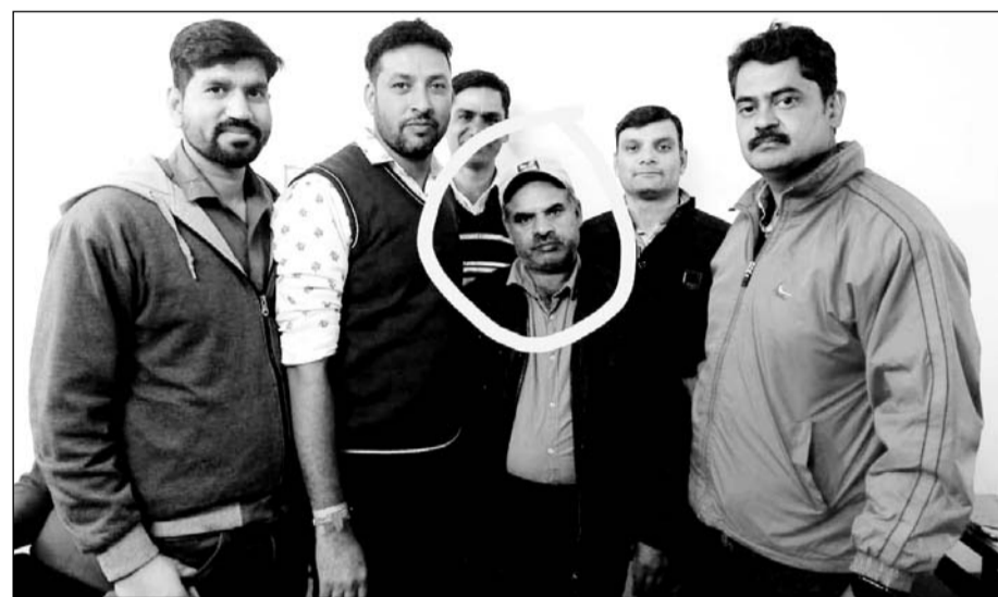
एसीबी की उदयपुर यूनिट ने आरोपी (गोल घेरे में) को गिरफ्तार किया।