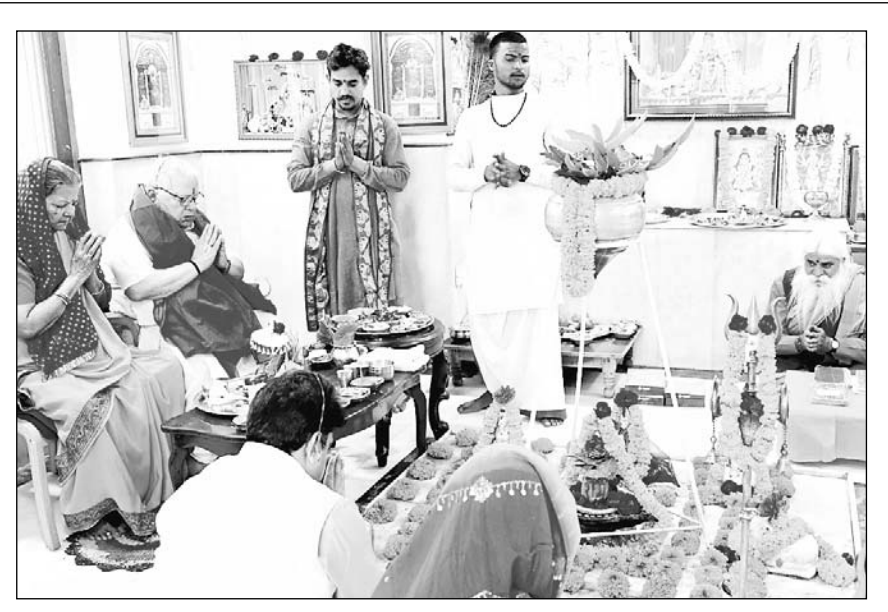
राज्यपाल कलराज मिश्र और राज्य की प्रथम महिला सत्यवती मिश्र ने बुधवार को नव संवत्सर 2080 और चैत्र नवरात्रि के आरम्भ पर राजभवन स्थित राज राजेश्वर मंदिर में मां दुर्गा की पूजा-अर्चना की। उन्होंने देवी आराधना कर सभी की खुशहाली, सम्पन्नता और बेहतरी के लिए कामना की। राज्यपाल कलराज मिश्र ने चैतीचण्ड पर्व ( 23 मार्च ) के अवसर पर भी देश और प्रदेशवासियों को बधाई एवं शुभकामनाएं दी हैं।