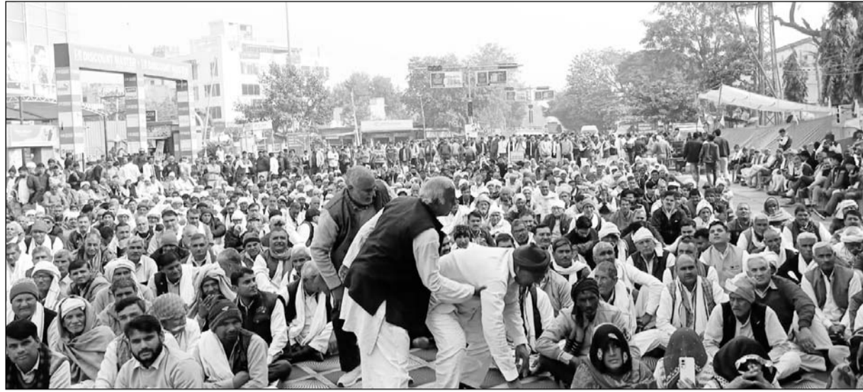
अलवर में यादव समाज के लोगों ने धरना प्रदर्शन किया।

‘सरकार गठन में अगर हमारी मांगें नहीं मानी तो हम चुप नहीं बैठेंगे’