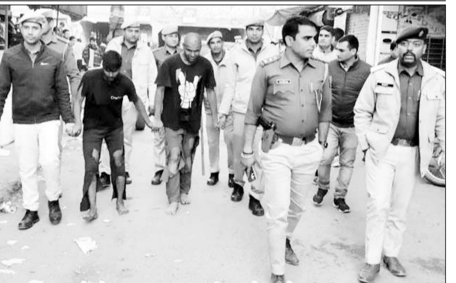
प्रागपुरा थाना पुलिस ने दो आरोपियों को गिरफ्तार कर पावटा कस्बे में जुलूस निकाला।