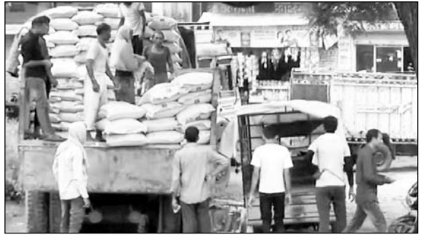
पावटा में खाद की रैक पहुंचने पर किसानों की भीड़ उमड़ी।