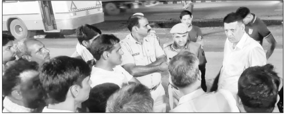
पुलिस ने मौके पर पहुंच मामले की जांच की।

पावटा, (नि.सं.)। हरियाणा रोडवेज की बस में बैठे लोग तब सहम गए, जब अचानक उन पर दो गाड़ियों में सवार लोगों ने हवाई फायरिंग व पत्थरबाव शुरू कर दिया। दरअसल ओल्ड राव होटल के पास जयपुर से नारनौल जा रही हरियाणा रोडवेज की बस पर फाँचुनर व हेरियर गाड़ी में आए बदमाशों ने हवाई फायरिंग व पत्थरबाव कर दिया और मौके से फरार हो गए।