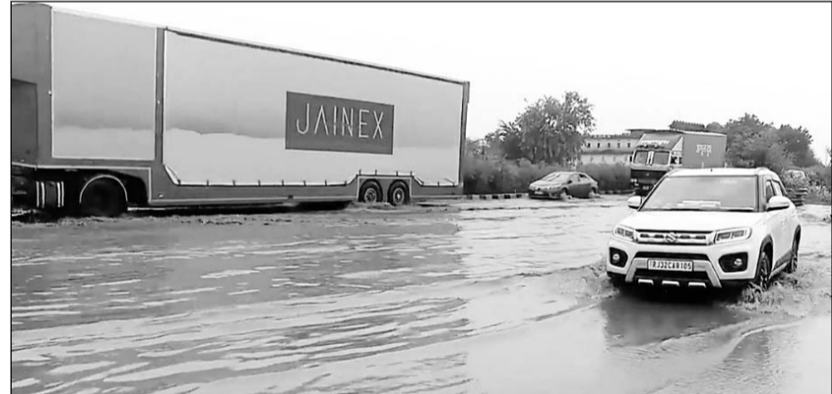
राष्ट्रीय राजमार्ग 48 पर बारिश मे भरा पानी।

पावटा, (नि.सं.)। राष्ट्रीय राजमार्ग 48 पर बरसात के पानी के भराव व उसकी निकासी नहीं होना एनएचआई अधिकारियों व प्रशासन की लापरवाही का नतीजा है। पावटा में बावडी मोड़ के पास मुख्य राष्ट्रीय राजमार्ग 48 पर बरसात का पानी जमा होने से राहगीरों, यात्रियों को भारी परेशानियों का सामना करना पड़ रहा है। प्राप्त जानकारी के अनुसार राष्ट्रीय राजमार्ग 48 पानी निकासी के लिए नाला तो बनवा दिया