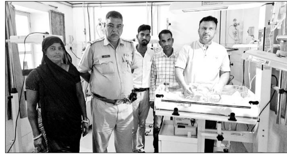
लाडपुरा में मिली नवजात बच्ची का पुलिस ने अस्पताल में उपचार कर बाल कल्याण समिति को सौंपा।

पुलिस ने अज्ञात के खिलाफ मामला दर्ज कर नवजात को बाल कल्याण समिति को सौंपा