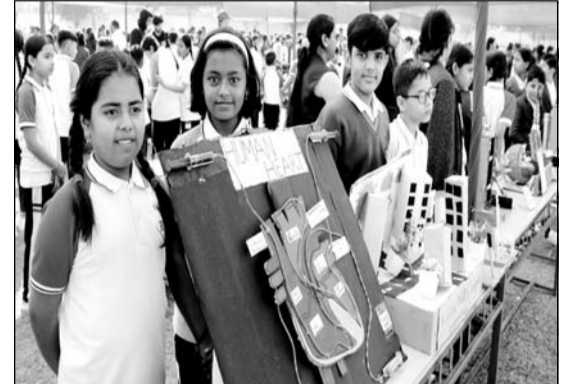
विज्ञान मेला 'प्रज्ञान' में स्कूली बच्चों ने बनाये मॉडल प्रदर्शित किये।