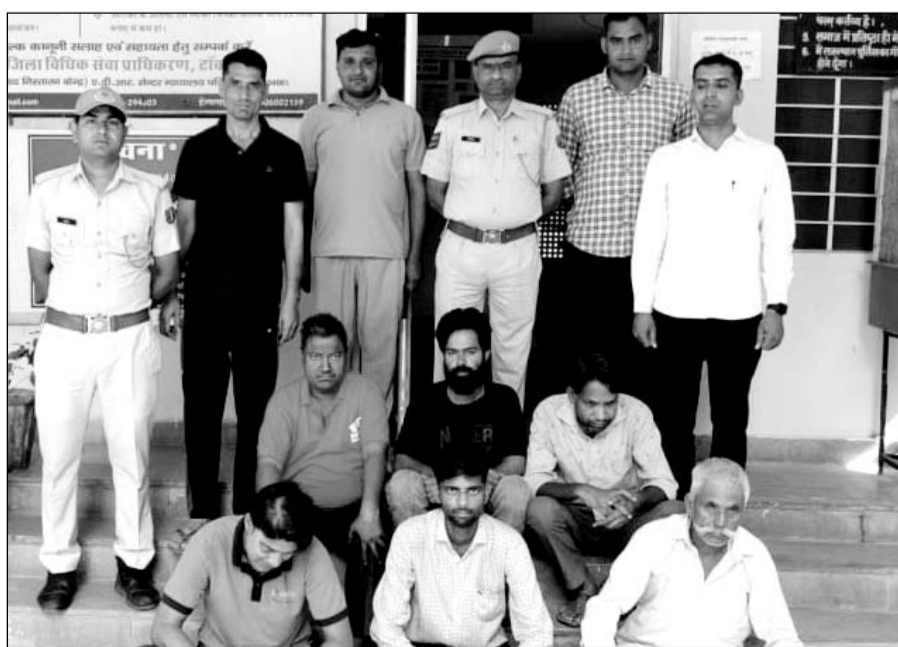
तीन स्थायी वारंटी व 4 गिरफ्तारी वारंटियों को अलग-अलग जगह से गिरफ्तार किया।