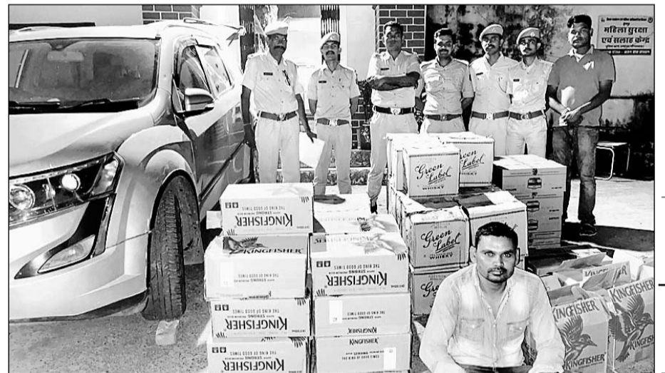
धंबोला पुलिस ने गुजरात के पुनावाडा चेक पोस्ट पर एक लगजरी कार से 5 लाख की अवैध शराब पकड़ी।

डुंगरपुर। धंबोला थाना पुलिस ने गुजरात से सटे पुनावाडा चेक पोस्ट पर एक लगजरी कार से 5 लाख की अवैध शराब पकड़ी है। कार ड्राइवर को शराब तस्करी के आरोप में गिरफ्तार कर लिया है। आरोपी शराब की तस्करी कर गुजरात ले जा रहा था। धंबोला थानाधिकारी ने बताया कि चौरासी विधानसभा उपचुनावों की आचार संहिता के तहत अवैध शराब के कारोबार पर सख्ती की जा रही है। गुजरात से सटे बाँडर पर गाड़ियों की तलाशी ली जा रही है। इसी दौरान पुनावाडा बाँडर पर रविवार रात को गुजरात नंबर की एक लगजरी एसयूवी कार को रूकवाया। कार की तलाशी में अवैध शराब भरी हुई मिली। कार ड्राइवर के पास शराब ले जाने के कोई कागजात भी नहीं था। जिस पर पुलिस ने शराब के साथ कार को जब्त कर लिया। कार से 75 पेट्टी शराब मिली है। जिसकी कीमत करीब 5 लाख रुपए बताई जा रही है। वहीं, शराब तस्करी कर