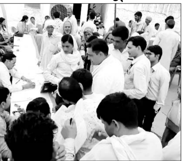
सक्षम अलवर अभियान के तहत शिविर में 351 से अधिक रजिस्ट्रेशन किए गए।