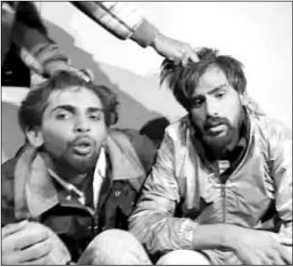
बच्चे को किडनेप करने वाले आरोपियों को पुलिस ने गिरफ्तार किया।