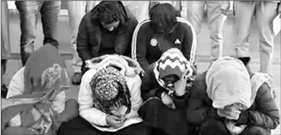
श्रीगंगानगर में कोतवाली थाना पुलिस ने कॉल सेंटर पर छापा मारकर चार युवतियां व दो युवकों को गिरफ्तार किया।