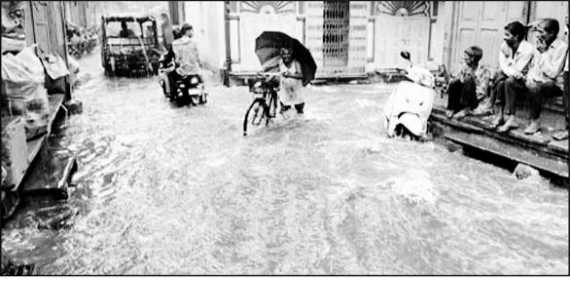
बुधवार दोपहर में झमाझम बारिश के बाद तेज बहाव से बहता पानी व उससे गुजरते वाहन व आमजन।

डूंगरपुर, (निसं)। जिले में पिछले दो दिनों से एक बार फिर मानसून की मेहर हो रही है हालांकि बारिश का यह दौर फसलों के लिए तो विशेष नहीं रहेगा लेकिन अभी भी रीते पड़े गेसागर जलाशय में थोड़ी बहुत राहत जरूर दे जायेगा। बीते 24 घंटों में जिले में सर्वाधिक बारिश फलोज में 64 एमएम रिकॉर्ड की गई है।