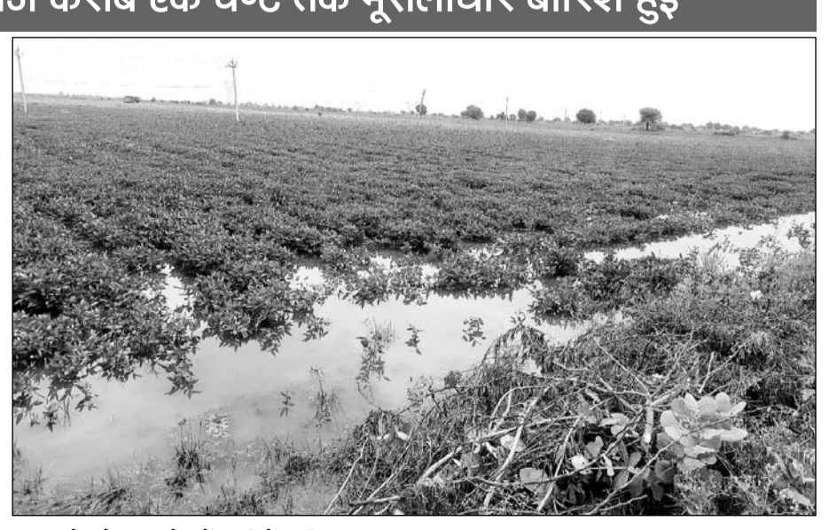
इटावा क्षेत्र के एक खेत में पानी में डूबी फसल।

किसानों ने बताया कि क्षेत्र में हालांकि अगस्त माह में हुई लगातार बारिश से फसलें खराब हो गयी थी थोड़ी बहुत आस थी लेकिन अब तो वह भी खत्म हो गयी। इस समय उड़द की फसल तो बिल्कुल सूख कर पक चुकी है कटाई का समय है लेकिन बारिश से