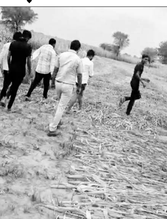
किसान व पुलिस की टीम ने पैथर को बाजरे के खेत में तलाश।

पैथर दिखने की सूचना पर स्थानीय महिला पुरुष, पुलिस और वन विभाग की टीमों ने पहुंच कर तलाश शुरू की लेकिन पैथर का अभी तक पता नहीं चल सका। टीम एवं ग्रामीणों का मानना है कि सम्भवतः पैथर झाड़ियों में छिपकर बैठा है। गौतलब है कि पूर्व में वन विभाग की टीम बकरे के साथ पिंजरा लगा चुकी है लेकिन पैथर वन विभाग व ग्रामीणों की हलचल से हर बार ओझल हो जाता है। पिछले 2 माह से क्षेत्र के चौसला गांव में पैथर का किसी ना किसी रूप में मूवमेंट दिखाई दे रहा है तब से लेकर आज तक ग्रामीण दहशत के माहौल में है।