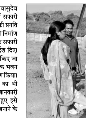
विधानसभा अध्यक्ष वासुदेव देवनानी ने निर्माणाधीन काजीपुरा लैपर्ड सफारी का निरीक्षण कर विभिन्न विकास कार्यों की प्रगति का जायजा लिया।

अधिकारियों ने बताया कि लगभग साढ़े चार हेक्टेयर क्षेत्र में शाकाहारी वन्यजीव संरक्षण क्षेत्र विकसित किया जा रहा है, जहां वन्यजीवों को प्राकृतिक वातावरण में अनुकूल बनाया जाएगा। बाद में उन्हें जंगल क्षेत्र में छोड़ा जाएगा। यहां घेराबंदी, आश्रय स्थल और जलकुंड का निर्माण भी बड़ेगा। उन्होंने सफारी क्षेत्र में बनाई जा रही काउंटर और प्रशासनिक भवन सहित विभिन्न स्थलों पर राजस्थान की वन्य धरोहर को दर्शाने वाली आकर्षक चित्रकारी करवाने के निर्देश दिए।