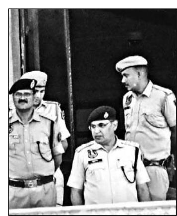
राजस्थान विधानसभा को आरडीएक्स से उड़ाने की धमकी मिलने की सूचना के सुरक्षा एजेंसियों, पुलिस और डाॅग स्कवॉड ने चप्पे-चप्पे की तलाश ली।

में कुछ तथ्यहीन और भटकाने वाली बातें लिखी गई थीं, जिन्हें गंभीरता से लेते हुए साइबर एजेंसियों द्वारा खोज का पता लगाने के प्रयास किए जा रहे हैं। उन्होंने कहा कि इस प्रकार की अफवाह फैलाने वालों के खिलाफ सख्त कानूनी कार्रवाई की जाएगी। साथ ही उन्होंने विधानसभा अधिकारियों और कर्मचारियों से धैर्य बनाए रखने की अपील करते हुए उनका मनोबल भी बढ़ाया। जांच पूरी होने के बाद विधानसभा सचिवालय की अधिकारी और कर्मचारी पुनः अपने कार्यस्थलों पर लौट आए और परिसर में सामान्य कामकाज बहाल हो गया।