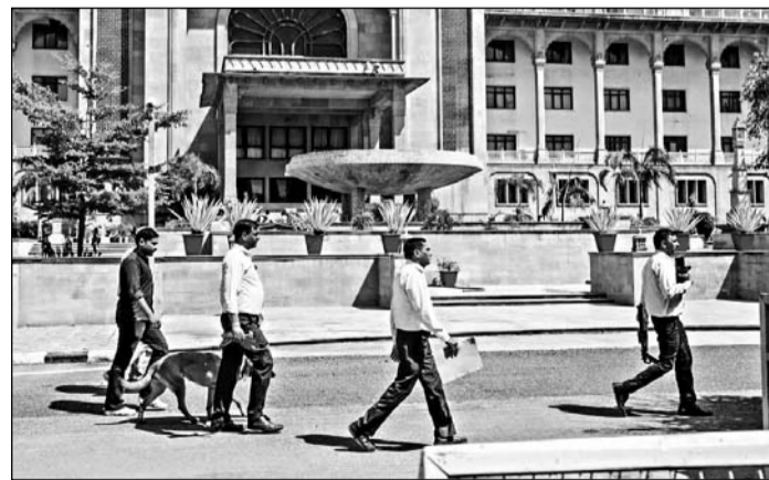
राजस्थान विधानसभा को आरडीएक्स से उड़ाने की धमकी मिलने की सूचना के सुरक्षा एजेंसियों, पुलिस और डाॅग स्कवॉड ने चप्पे-चप्पे की तलाश ली।

जयपुर (कासं)। राजस्थान विधानसभा को आरडीएक्स से उड़ाने की धमकी भरा ईमेल मिलने के बाद सोमवार को हड़कंप मच गया, लेकिन सुरक्षा एजेंसियों की सघन जांच में यह धमकी पूरी तरह फर्जी पाई गई। इस मामले में विधानसभा अध्यक्ष वासुदेव देवनांनी ने तत्परता दिखाते हुए तुरंत राज्य के पुलिस महानिदेशक को सूचना दी और पूरे घटनाक्रम पर लगातार नजर बनाए रखी। एहतियातन विधानसभा परिसर को खाली कराया गया, जिसके बाद बम निरोधक दस्ते और विशेष पुलिस बल ने मौके पर