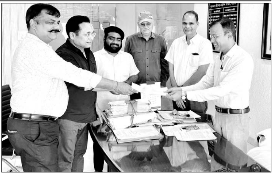
वन्य जीव प्रेमियों ने मुख्य वन संरक्षक को ज्ञापन सौंपा।

हम लोग संस्था एवं पगामार्क फाउंडेशन की ओर से दरा में आयोजित बाघ चौपाल की कार्यवाही का विवरण प्रस्तुत किया। उक्त बैठक में ग्रामीणों के साथ चर्चा करते हुए दरा रेंज में बाघों को बसाने के संबंध में विचार प्राप्त किए गए थे। वर्तमान में सेल्वर रेंज में बाघ और बाघिन का