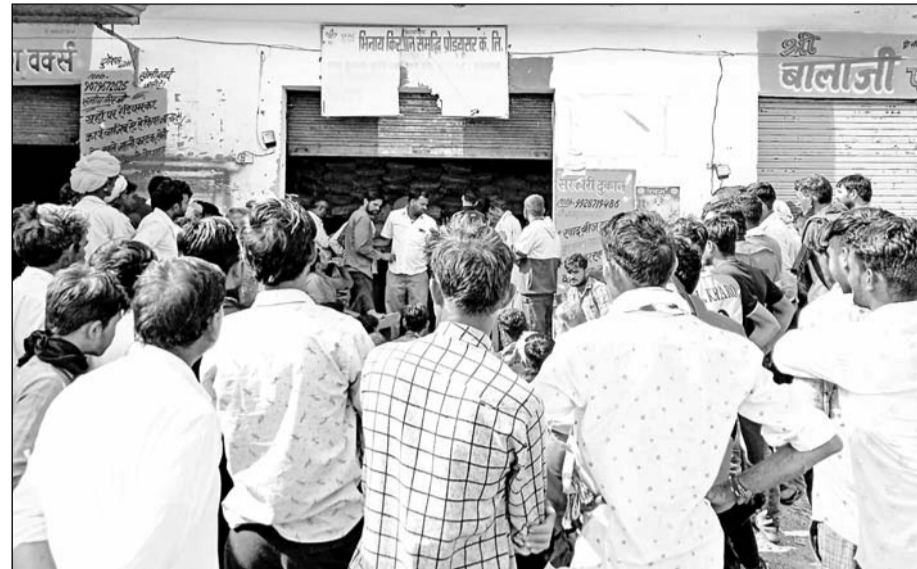
नागोला ग्राम सेवा सहकारी समिति पर जमा किसान।

560 लोगों को वितरित किए कट्टे, कई किसानों को खाली हाथ लौटना पड़ा