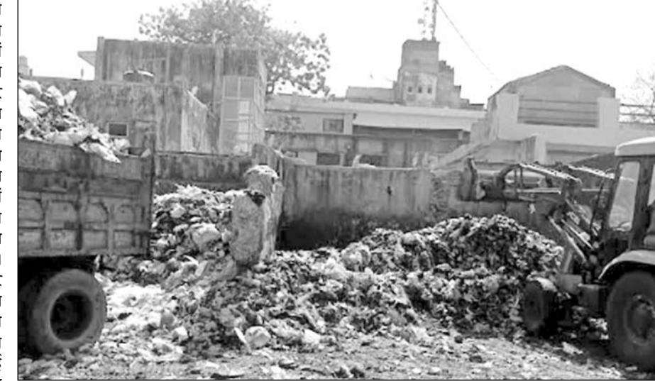
अजमेर के गंज क्षेत्र के मुख्य मार्ग पर लगा गंदगी का ढेर।

अजमेर, (निसं)। स्मार्ट सिटी कहलाने वाले अजमेर शहरभर में सरकारी आवासीय योजनाओं व कॉलोनियों में खाली पड़े भूखंडों सहित शहर के मुख्य मार्गों पर खाली स्थानों पर मिट्टी और निर्माण सामग्री का मलबा डाला जा रहा है। इससे न केवल आस-पड़ोस में गंदगी फैल रही है, बल्कि शहर की स्वच्छता रैंकिंग पर भी प्रतिकूल असर पड़ रहा है। अजमेर शहर की स्वच्छता रैंकिंग में गिरावट की सबसे बड़ी वजह सरकारी मशीनरी की लापरवाही और आमजन की उदासीनता व जागरूकता में कमी है। वहीं गंज क्षेत्र में बना कचरा डिपो शहर की स्वच्छता में कौढ़ में खाज का काम कर रहा है। कमोवेश शहर भर में यही स्थिति बनी हुई है। तो वहीं आज भी शक्ति नगर वार्ड नम्बर में 54 की कई गलियों में डोर टू डोर कचरा संग्रहण करने वाला ऑटो टीपर नहीं आता है, जिसके कारण क्षेत्रवासी कचरा कॉलोनियों के खाली प्लाटों में ही डाल देते हैं, जिसके कारण गंदगी का आलम बना हुआ है।