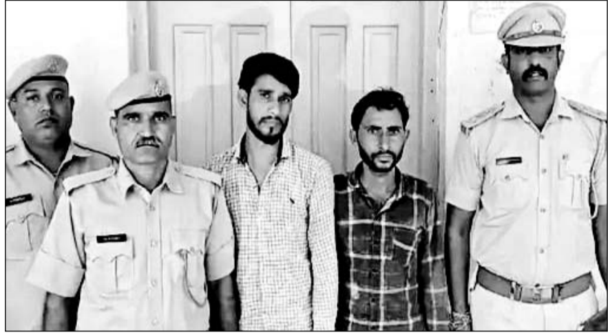
सरिस्का के बफर ज़ोन में करंट लगाकर शिकार करने वाले दो शिकारियों को गिरफ्तार किया।