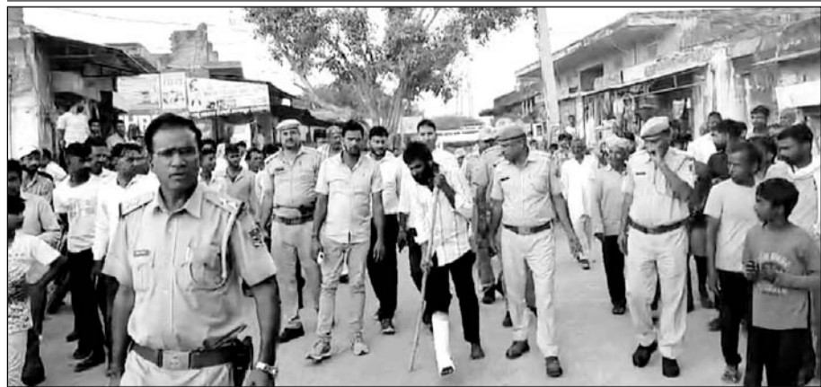
पाटन पुलिस ने पिस्तौल की नोक पर लूटपाट करने वाले अपराधियों को गिरफ्तार कर रायपुर-पाटन गांव में जुलूस निकाला।

पुलिस दोनों आरोपियों को रायपुर-पाटन गांव में ले जाकर जुलूस निकाला