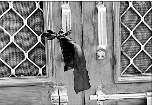
हिंदू समाज के लोगों ने घरों के बाहर विरोधस्वरूप काली पट्टियां बांधी

जानकारी के अनुसार उपनगर सांगानेर में दो दिन पहले गणेश पंडाल पर कुछ लोगों ने पथराव किया, जिससे माहौल गरमा गया था। बीती रात को भी सकल हिंदू समाज के लोगों ने कार्यवाही और कुछ मार्गों को लेकर पुलिस चौकी का घेरा किया, देर रात तक कोई समझौता नहीं हो पाया और सकल हिंदू समाज ने फैसला किया कि वह दूसरे पक्ष के त्योंहार को नहीं देखेंगे। इसी के चलते सोमवार सुबह काली मंगरी चले गए, जहां वह भजन कीर्तन कर रहे हैं और सामूहिक भोज का आयोजन किया