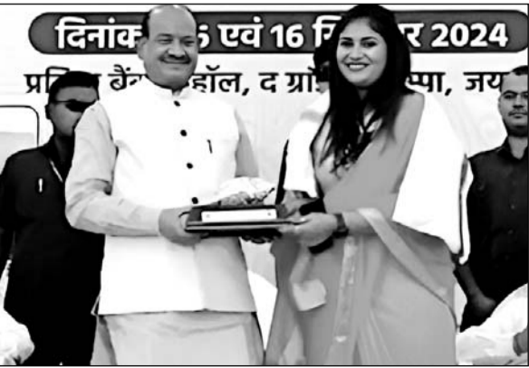
राजसमंद में आयोजित कार्यशाला में लोकसभा अध्यक्ष ओम बिरला, विधायक दीप्ति माहेश्वरी आदि मौजूद रहे।

उन्होंने कार्यशाला की सराहना करते हुए कहा कि राष्ट्रीय वैश्य महासम्मेलन विकसित भारत की संकल्पना को साकार करने के लिए समाज में सजगता और एकता लाने का महत्वपूर्ण कार्य कर रहा है। कार्यशाला के मुख्य वक्ता लोकसभा अध्यक्ष ओम बिरला ने भी इस बात पर जोर दिया कि राजनीति और समाज में हमें जाति के आधार पर नहीं बल्कि हमारे कार्यों और समाज में योगदान के आधार पर अपना