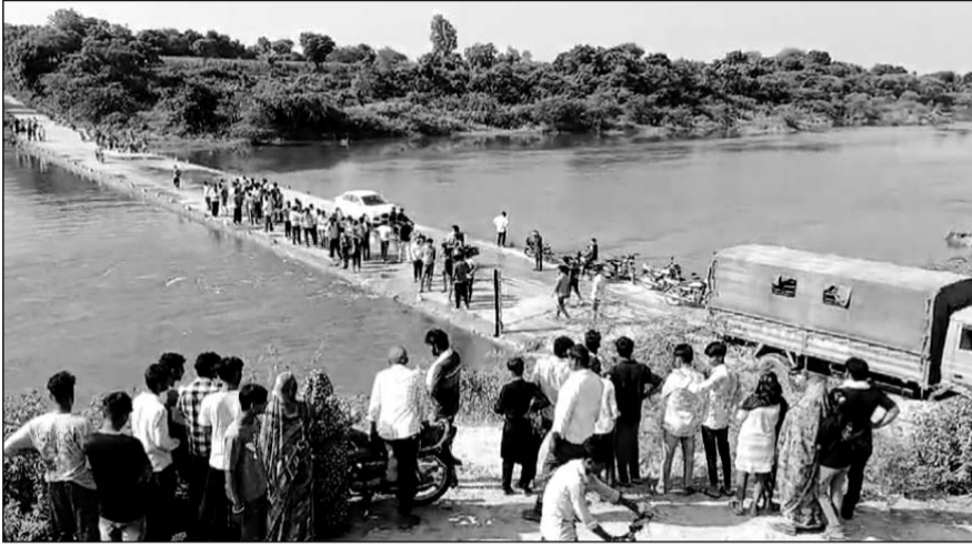
मांडलगढ़ में बीगोद के पास बनास नदी में बहे मां-बेटे के शव 21 घण्टे बाद मिले।