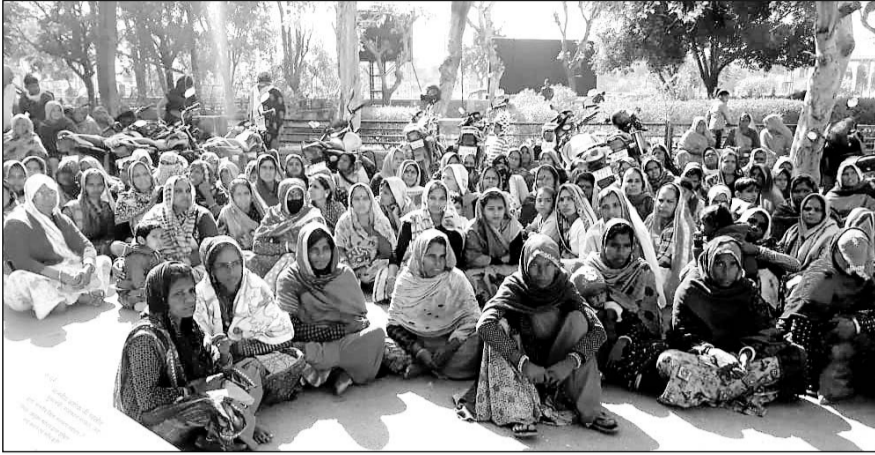
भुगतान नहीं मिलने पर कलेक्ट्रेट पर प्रदर्शन करती इंदिरा गांधी शहरी रोजगार योजना से जुड़ी महिलाएं।

महिला मजदूरों का आरोप है कि उन्हें लंबे समय से भुगतान नहीं मिला है। जब वह नगर परिषद आयुक्त के पास अपनी शिकायत को लेकर पहुंची