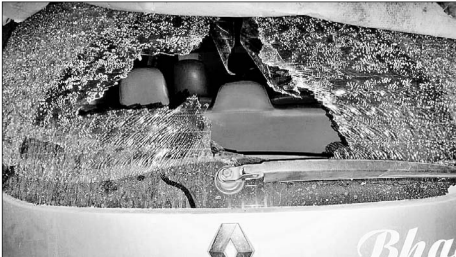
हिरण मगरी थाना क्षेत्र में खड़ी कांग्रेस नेता की गाड़ी।

उदयपुर, (कास)। हिरण मगरी थानाक्षेत्र के सेंट्रल एरिया में मध्यरात्रि बाद घर के बाहर खड़ी गाड़ी के अज्ञात लोगों ने कांच फोड़ दिए। कॉलोनी की जिस गली में वारदात हुई वहां अन्य चार पहिया वाहन थे, लेकिन सिर्फ इस वाहन को ही निशाना बनाने से किसी साजिश की आशंका है।