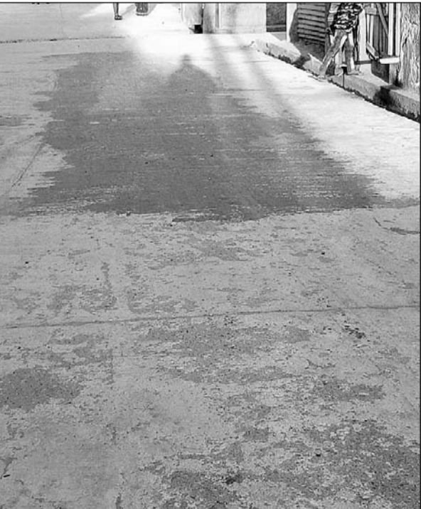
सुजानगढ़ सी.सी. सड़क पर खानापूर्ति के लिए लगाया गया डामर।