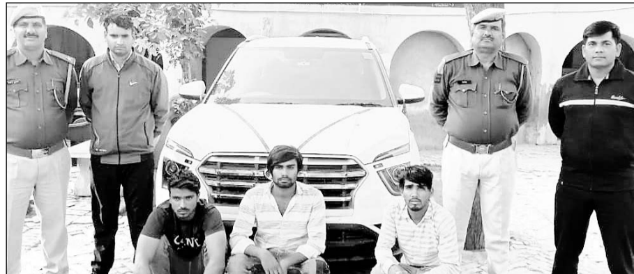
साइबर ठगों से कार बरामद कर उन्हें गिरफ्तार किया।

ठगों से आठ एटीएम कार्ड, चार मोबाइल, एक स्वाइप मशीन, 1,25,000 नकदी व एक कार जप्त की