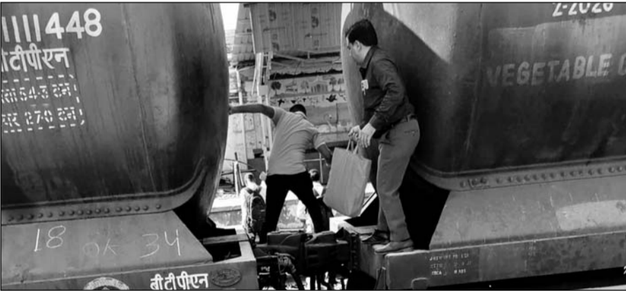
फुलेरा जंक्शन पर रेलयात्री जान जोखिम में डालकर रेलवे स्टेशन पहुंच रहे हैं।

परेशानियों का सामना करना पड़ेगा। प्रशासन द्वारा रेलवे स्टेशन के अंतिम छोर में बनाया गया ओवरब्रिज भी काफी ऊंचा होने के कारण बुजुर्गों को यहां से आने-जाने में काफी दिक्कतों का सामना करना पड़ता है। इसके चलते यहां एक्सेलेटर या लिफ्ट लगे तो जरूर इनको राहत मिल सकती है लेकिन अभी वर्तमान में स्थिति काफी दयनीय है। जबकि फुलेरा से प्रतिदिन 15 हजार से अधिक दैनिक रेलयात्री अपनी रोजी रोटी कमाने के लिए जयपुर एवं अजमेर सहित अन्य स्थानों के लिए अप-डाउन करते हैं। कई बार तो ओवरब्रिज होकर जाते जाते इनकी ट्रेन भी छूट जाती है।