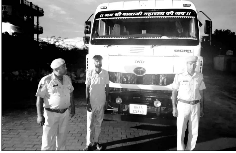
मेहाड़ा पुलिस ने एक ट्रेलर को जब्त कर 58 टन बजरी बरामद की है।

निर्देश पर एक विशेष टीम का गठन किया गया तथा मामले में प्रभावी कार्रवाई करने के निर्देश दिए गए। इस दौरान पुलिस ने मेहाड़ा से खेतड़ी जाने वाली सड़क पर नाकाबंदी कर खनन क्षेत्र से आ रहे वाहनों की जांच की गई।