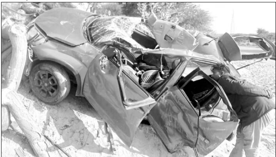
हादसे में कार पूरी तरह से क्षतिग्रस्त हो गयी।

राजलदेसर, (निसं)। राजलदेसर में नेशनल हाइवे-11 पर परसनेके के पास तेज गति से दौड़ती हुई कार अनियंत्रित होकर हाइवे के साइड में जाकर एक पेड़ से टकरा गई। हादसे में कार सवार दो महिलाएं व दो पुरुष गंभीर घायल हो