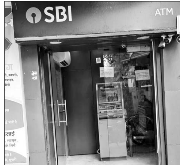
एटीएम मशीन को खोलकर नगदी निकालने का प्रयास किया गया।

नवलगढ़, (निसं)। कस्बे के बावड़ी गेट बस स्टैंड चौक में लगे एसबीआई के एटीएम मशीन को खोलकर नगदी निकालते चोर को रंगे हाथों एटीएम गार्डों ने दबोच लिया। जरा सी चूक हो जाती तो चोर पैसे लेकर अपने दो साथियों सहित फरार हो जाते। एटीएम