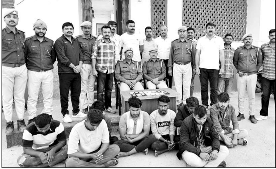
साबला पुलिस व सायबर सेल ने आठ ठगों को गिरफ्तार किया।

खेतों में पेड़ों पर मचान बनाकर सायबर ठगी को अंजाम दे रहे थे आरोपी