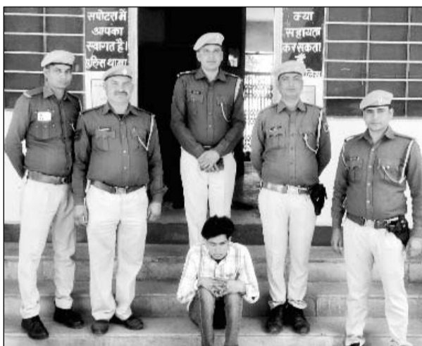
सपोटरा थाना पुलिस ने सायबर ठगी के आरोपी को गिरफ्तार किया।

■ पुलिस को आरोपी के बैंक खातों में लाखों रुपए का संदिग्ध लेन-देन मिला है