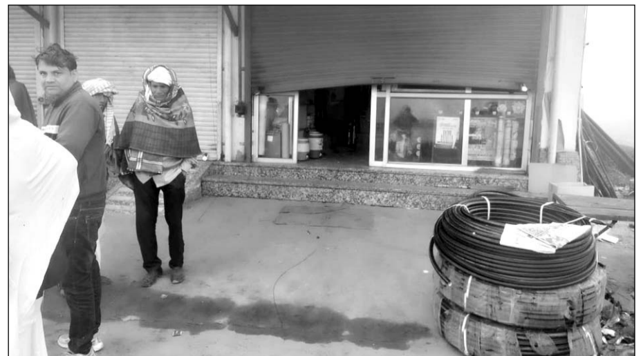
चोरी की वारदात के बाद मोके पर लोग जमा हो गए।