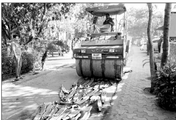
मॉडिफाईड साईलेंसरों को यातायात पुलिस ने नष्ट करवाया।