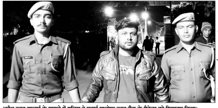
अवैध ब्लड सप्लाय के मामले में पुलिस ने सर्वाई माधोपुर ब्लड बैंक के मैनेजर को गिरफ्तार किया।

सांभरझील, (निसं)। गत दिनों मकराना में ब्लड बैंक शिविर लगाकर 255 यूनिट मानव खून की तस्करी से जुड़े मामले में पुलिस ने एक और आरोपी को गिरफ्तार किया है। गिरफ्तार आरोपी ने पूछताछ में पुलिस को सर्वाई माधोपुर ब्लड बैंक में प्रबंधक के पद पर काम करना बताया।