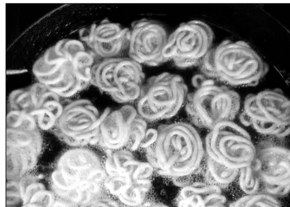
भीलवाड़ा जिले की प्रसिद्ध मिठाई "मुरका"।