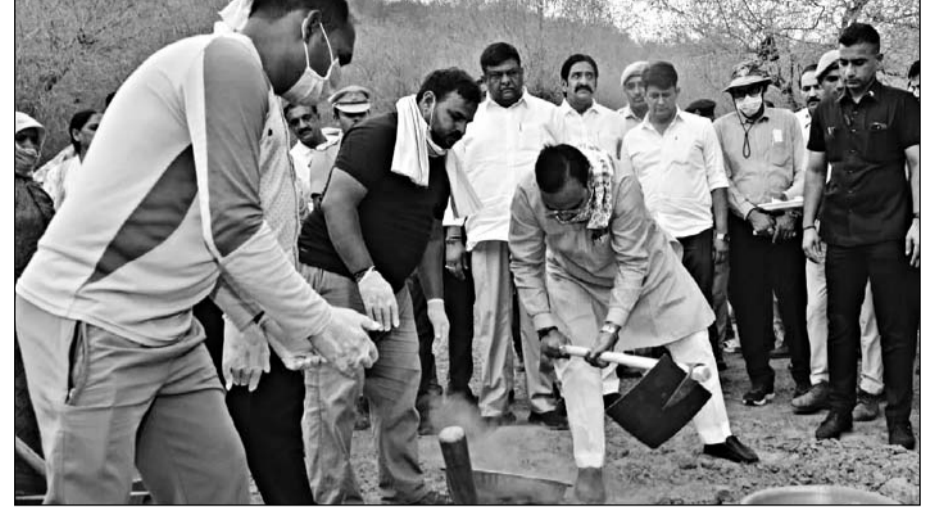
मुख्यमंत्री भजनलाल शर्मा ने शुक्रवार को नींदड वन क्षेत्र में बंदे गंगा जल संरक्षण-जन अभियान के तहत एनिकट पर श्रमदान किया।

जयपुर (कांस)। मुख्यमंत्री भजनलाल शर्मा ने शुक्रवार को नींदड वन क्षेत्र में नींदड-बैनाड बायोडाइवर्सिटी प्रोजेक्ट ईको ट्रेल का उद्घाटन किया। इस अवसर पर उन्होंने बंदे गंगा जल संरक्षण-जन अभियान के तहत एनिकट पर श्रमदान कर आमजन से जल संरचनाओं के संरक्षण एवं संवर्धन में सहभागिता निभाने का आह्वाण किया। मुख्यमंत्री ने कहा कि नींदड वन अत्यंत सुंदर और संभावनाओं से परिपूर्ण क्षेत्र है। राज्य सरकार इसे सघन पौधारोपण के माध्यम से विकसित करेगी, ताकि यहां प्रकृति पर्यटन को भी बढ़ावा मिल सके। उन्होंने कहा कि बंदे गंगा जल संरक्षण-जन अभियान के अंतर्गत