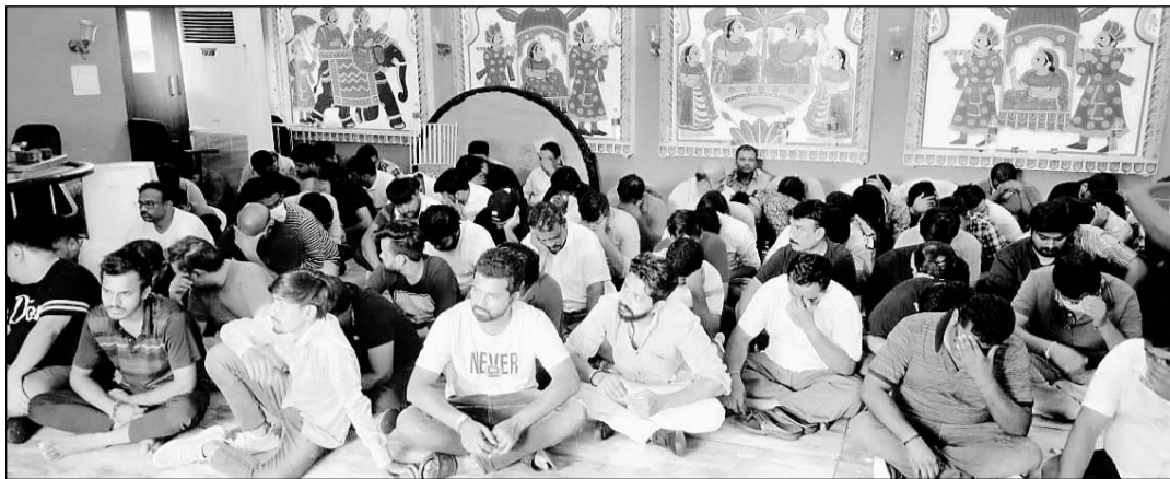
जयपुर पुलिस ने जयसिंहपुरा खोर स्थित सायपुरा फार्म हाऊस में कसिनो व डांस बार में छापामार कर 84 लोग पकड़े।

-कार्यालय संवाददाता- जयपुर। पुलिस कमिश्नरेट की सीएसटी टीम ने जयसिंहपुरा खोर में फार्म हाउस सायपुरा बाग में चल रहे कसिनो और डांस बार में दबिश देकर इवेंट संचालक, पुलिस इंस्पेक्टर, तहसीलदार और प्रोफेसर समेत 84 लोगों को गिरफ्तार किया है। पकड़े गए लोगों में 13 महिलाएं भी शामिल हैं। पुलिस ने मौके से 44 अंग्रेजी शराब की बोतल, 66 बीयर की बोतल, 14 लंगरी कार, एक ट्रक और 23 लाख 71 हजार 408 रुपए बरामद किए हैं।