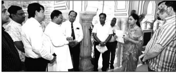
जयपुर विवाह स्थल समिति, जयपुर के पदाधिकारीओं ने उप मुख्यमंत्री दिया कुमारी को मांगों को लेकर ज्ञापन सौंपा।

सुशासन, पारदर्शिता और जनकेन्द्रित प्रशासन को दी प्राथमिकता