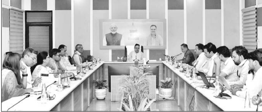
मुख्यमंत्री भजन लाल शर्मा ने अधिकारियों के साथ बैठक कर स्वास्थ्य, ग्रामीण विकास, शिक्षा, पेयजल सम्बंधी दिशा निर्देश दिए।

इस योजना के अंतर्गत राज्य को वित्तीय वर्ष 2025-26 में 10 हजार 548 करोड़ की राशि प्राप्त हुई है,