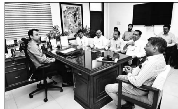
अधिकारियों के साथ औपचारिक बैठक लेकर ली विभिन्न परियोजनाओं की जानकारी।