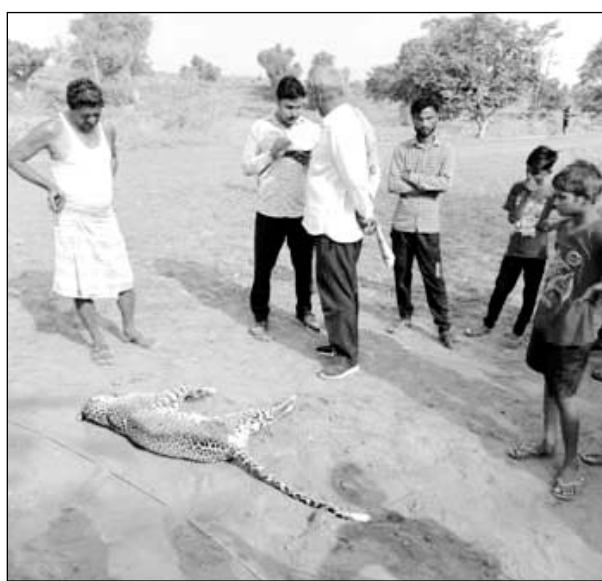
मृत पड़ा पैंथर शावक एवं मौके पर उपस्थित ग्रामीण।

मासलपुर, (निसं)। मासलपुर के निकटवर्ती खनुपुरा गांव में बीती रात के बाद खेतों से गुजर रहे एक पैंथर शावक की खेत में टूटे पड़े बिजली तार की चपेट में आने से मौके पर ही मौत हो गई। घटना का पता सोमवार प्रातः लगा जब ग्रामीण अपने खेतों की ओर गए। ग्रामीणों ने विद्युत निगम को सूचना देकर बिजली सप्लाय बंद कराई एवं पैंथर के शावक की मौत की सूचना वन विभाग को दी। सूचना पाकर वन विभाग में खलबली सी मच गई।