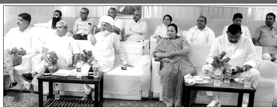
जालोर शहर के एक निजी होटल में वीडियो कॉन्फ्रेंसिंग के माध्यम से शिलान्यास कार्यक्रम का आयोजन किया गया। इस दौरान जनप्रतिनिधि व कई लोग मौजूद रहे।

जालोर शहर के एक निजी होटल में वीडियो कॉन्फ्रेंसिंग के माध्यम से शिलान्यास कार्यक्रम का आयोजन किया गया। कार्यक्रम में केन्द्रीय सड़क, परिवहन व राजमार्ग मंत्री नितिन गडकरी ने कहा कि केन्द्र सरकार ने राजस्थान में सड़कों का जाल बिछाने का कार्य किया गया है। सड़क मार्ग के रूप में राजस्थान अग्रणी है। जालोर में आरओबी बनने से लोगों को राहत मिलेगी। वहीं उन्होंने कहा कि यह तो अभी ट्रेलर है पूरी फिल्म तो अभी बाकी है। राजस्थान के लिए कई कार्यों की सौगात दी जायेगी। भाजपा सरकार राजस्थान में राजमार्ग बनाने के लिए कटिबद्ध है। सांसद देवजी पटेल ने भी वीसी के माध्यम से दिल्ली से सम्बंधित करते हुए कहा कि जालोर से आहोर जाने वाले मार्ग पर रेलवे क्रासिंग के चलते कई घंटे लोगों को इंतजार करना पड़ता था। जिसको लेकर मेरे द्वारा लगातार केन्द्र