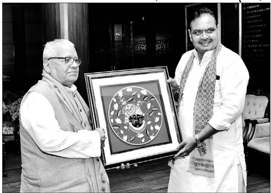
मुख्यमंत्री भजन लाल शर्मा ने सोमवार को राजभवन पहुंचकर राज्यपाल कलराज मिश्र को जन्मदिन की बधाई और शुभकामनाएं दी। मुख्यमंत्री ने मिश्र को जन्म दिन पर श्रीनाथजी की छवि भी उपहार स्वरूप भेंट की। मुख्यमंत्री ने राज्यपाल के स्वस्थ और दीर्घायु जीवन की कामना की।

जयपुर। राष्ट्रपति द्रौपदी मुर्मू व उपराष्ट्रपति जगदीप धनखड़ ने सोमवार को फोन कर राज्यपाल कलराज मिश्र को जन्मदिन की बधाई और शुभकामनाएं दी। उन्होंने फोन पर राज्यपाल मिश्र के आदर्श व्यक्तित्व और अनुकरणीय बताते हुए उनके स्वस्थ और दीर्घायु जीवन की कामना की। राज्यपाल के जन्म दिन पर सोमवार प्रातः प्रधानमंत्री नरेन्द्र मोदी ने उन्हें फोन