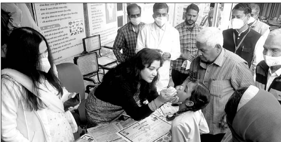
शिविर में बच्चों को स्वर्ण प्राशन की दवा पिलाई गई।