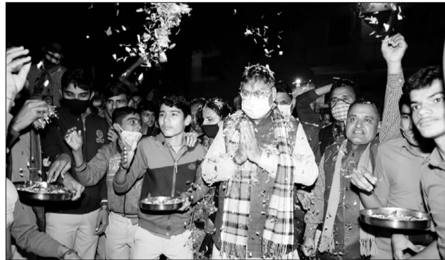
जैसलमेर में पूनिया पर पुष्प वर्षा कर लोगों ने स्वागत किया।

सतीश पूनिया 9 जनवरी को विभिन्न संगठनात्मक बैठकों में पदाधिकारी और प्रमुख कार्यकर्ताओं के साथ संवाद करेंगे इसके अलावा बाड़मेर जिले के संगठनात्मक प्रवास पर पहुंचे डॉ.