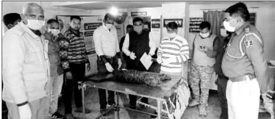
करौली पशु चिकित्सालय में मादा लेपर्ड के शव का चिकित्सकों की टीम ने पोस्टमार्टम किया।