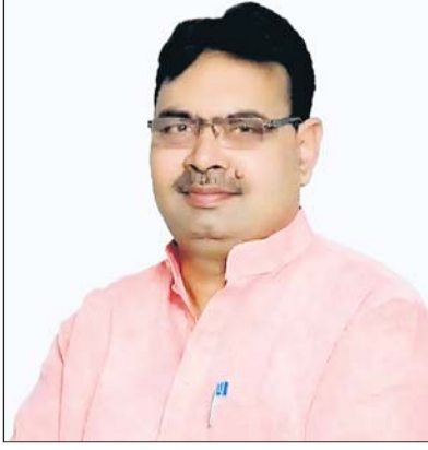
मुख्यमंत्री भजनलाल शर्मा

जयपुर महानगर में इन्सीडेन्ट कमाण्डर नगर निगम जयपुर हैरिटेज/ग्रेटर एवं जयपुर विकास प्राधिकरण से समन्वय कर संसाधनों का आंकलन करना एवं बाढ़ की स्थिति में राहत गतिविधियों का