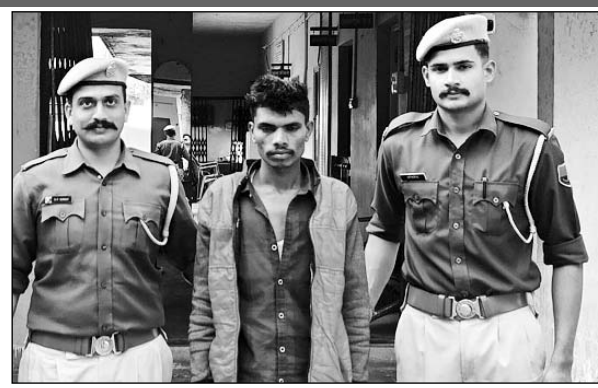
पुलिस ने घड़्यंत्र में शामिल प्रेमी को गिरफ्तार किया।