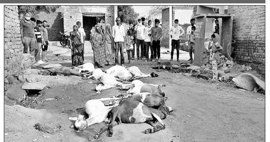
धौलपुर जिले के मनिगां थाना इलाके के गांव खेरली में मौके पर मृत पड़ी बकरियां।