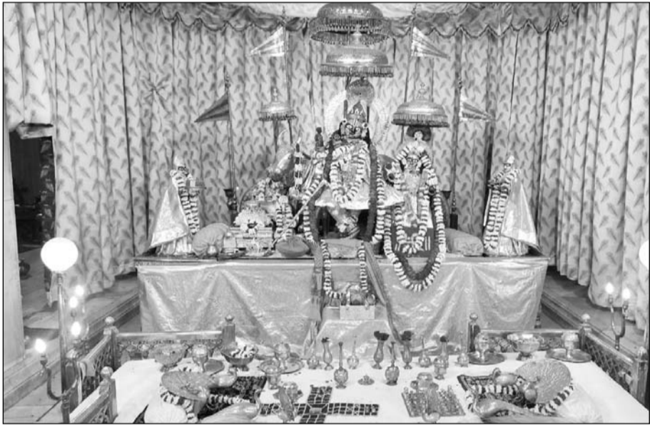
गोविंददेवजी मंदिर में ठाकुर श्रीजी के सम्मुख रास का खाट और चौसर, शतरंज की झांकी सजाई गई।