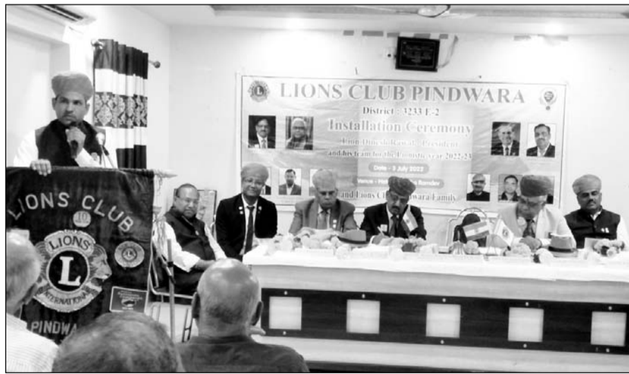
पिंडवाड़ा में लॉयंस क्लब के 37 वें शपथ समारोह का कार्यक्रम आयोजित हुआ।