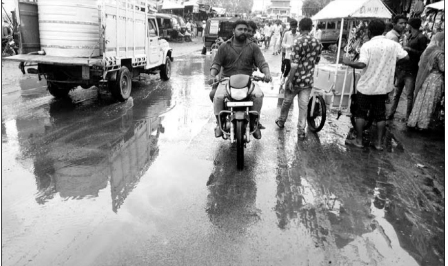
सिवाना के गांधी चौक पर पानी भरा होने से राहगीरों व वाहन चालकों को परेशानी हो रही है।

सिवाना, (निर्सं)। बाड़मेर जिले के सिवाना गत दिनों के भयंकर गर्मी व उमस ने आमजन को बेहाल कर दिया है। उमस के कारण ग्रामीणों का सामान्य जनजीवन अस्त व्यस्त हो गया है। लंबे समय से मानसून का इंतजार रहे लोगों को सोमवार को झमाझम बारिश से मौसम सुहावना बन गया।