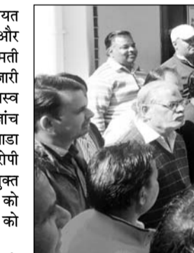
आरोपितों की गिरफ्तारी की मांग को लेकर सरपंच संघ ने बीडीओ को ज्ञापन दिया।

मांडलगढ़, (निर्स)। मांडलगढ़ पंचायत समिति की ग्राम पंचायत काछोला में सरपंच और ग्राम विकास अधिकारी ने सरकारी बेशकीमती भूमि में 50 से अधिक पट्टे नियम विरुद्ध जारी किए। जिससे पंचायत को करोड़ों के राजस्व की चपत लगी। इस मामले में विभागीय जांच में सरपंच और बीडीओ को दोषी मान भीलवाड़ा जिला परिषद सीईओ ने दो माह पूर्व दोनों आरोपी के खिलाफ कार्रवाई के लिए सम्भागीय आयुक्त को पत्र प्रेषित किया लेकिन अब कार्रवाई को ठंडे बस्ते में डाल सरपंच और बीडीओ को बचाया जा रहा है।